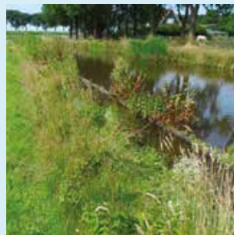
Voldoende zoet water (alleen HHNK)