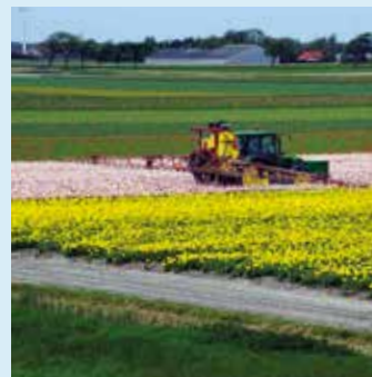
Gewas- en dierbeschermings- middelen (perceel én erf)