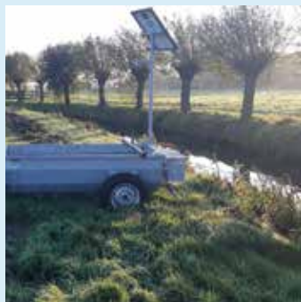
Perceel- en oeverinrichting